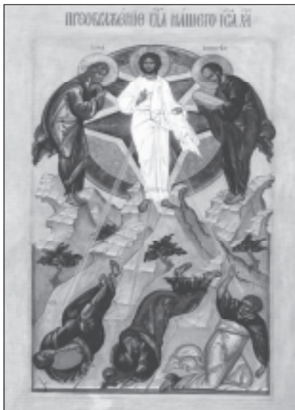
Преображение Господне. Современная икона.

престоле храма Святой Софии, а далее — до праздника Успения Пресвятой Богородицы — носили по городу, совершая молебные пения и предлагая народу для поклонения. Именно это и называется Происхождением (изнесением) Честнаго и Животворящего Креста. В Русской Церкви это празднество соединилось с воспоминанием Крещения Руси, совершившегося 1 августа (старого стиля) 988 года.