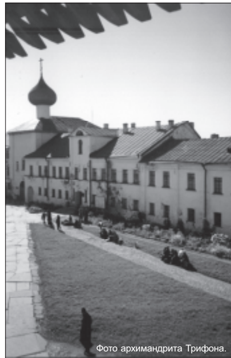
Фото архимандрита Трифона.

Подробный фоторепортаж об этой встрече и о соловецких торжествах читайте в следующем номере нашей газеты.