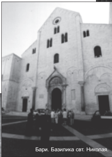
Бари. Базилика свт. Николая.