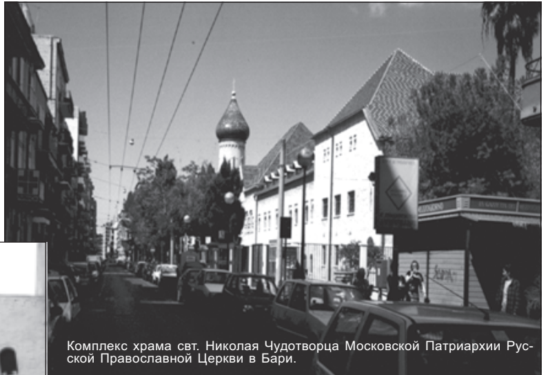
Комплекс храма свт. Николая Чудотворца Московской Патриархии Русской Православной Церкви в Бари.

В поездке читались акафисты и другие молитвы, паломники готовились к причастию, исповедовал один из шести священников — отец Феофан, архимандрит, духовник Жировицкого монастыря. Минуло полтора года, как возобновилось представительство Русской Православной Церкви в Бари и появилась возмож-